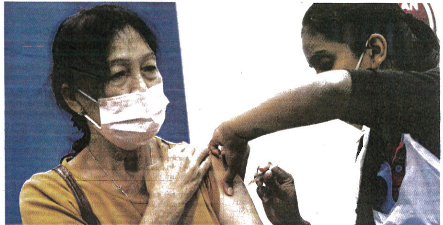
PETUGAS perubatan memberikan suntikan dos penggalak vaksin Covid-19 kepada seorang wanita di Pusat Pemberian Vaksin (PPV) Offsite Tapak Ekspo Seberang Jaya, Pulau Pinang.

Sejumlah 15,595,578 individu atau 66.3 peratus populasi dewasa di dalam negara pula sudah menerima dos penggalak dan 22,947,925 atau 97.5 peratus lengkap vaksinasi manakala 23,224,065 atau 98.7 peratus telah menerima sekurang-kurangnya satu dos vaksin.