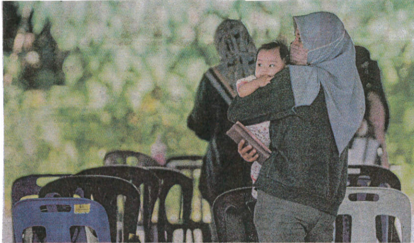
A woman holding a baby waiting for her turn at a Covid-19 Assessment Centre in Kajang on Friday.