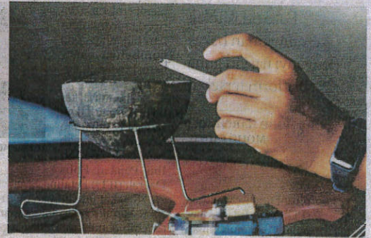
RUU larangan merokok dibentangkan sebagai usaha untuk mengurangkan perokok dalam kalangan generasi muda di negara ini.

Rang undang-undang tersebut sedang dimuktamadkan oleh Peguam Negara."